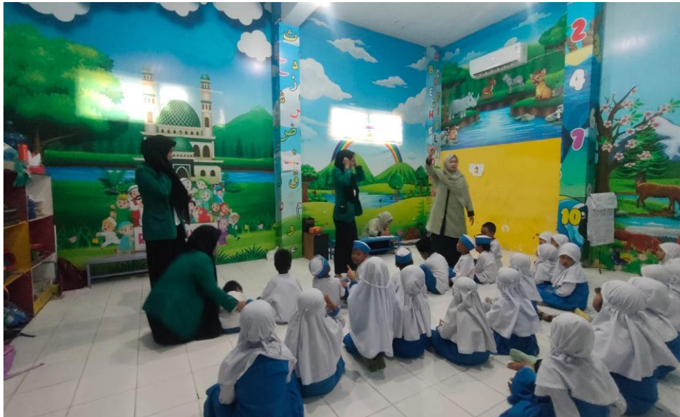
Gambar 1 Kegiatan Bercerita Siklus I

Kegiatan pembelajaran pada siklus I menggunakan tema "Tanaman Sayuran" dengan sub-fokus pada pengenalan dan pengolahan wortel. Penataan ruang kelas diatur dalam formasi setengah lingkaran untuk memfasilitasi interaksi yang lebih baik antara guru dan anak. Pada kegiatan pembukaan, guru memulai dengan pengenalan media pembelajaran dan penjelasan aturan kegiatan. Kegiatan inti melibatkan anak dalam proses mencuci dan mengolah wortel menjadi minuman sehat, diikuti dengan diskusi tentang manfaat sayuran.