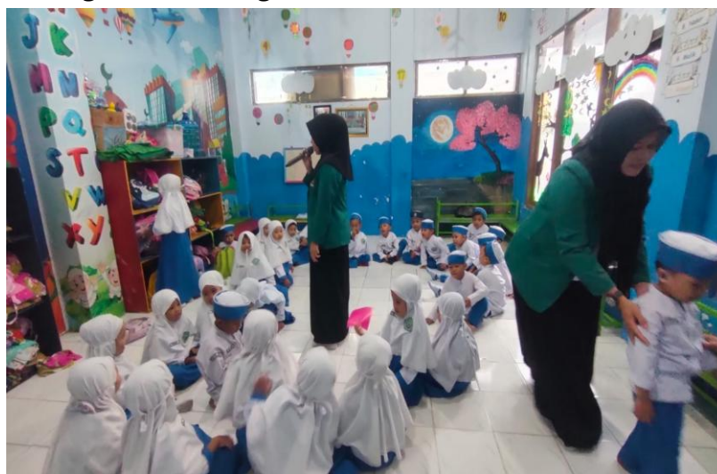
Gambar 3 Kegiatan Meningkatkan Komunikasi anak Siklus II