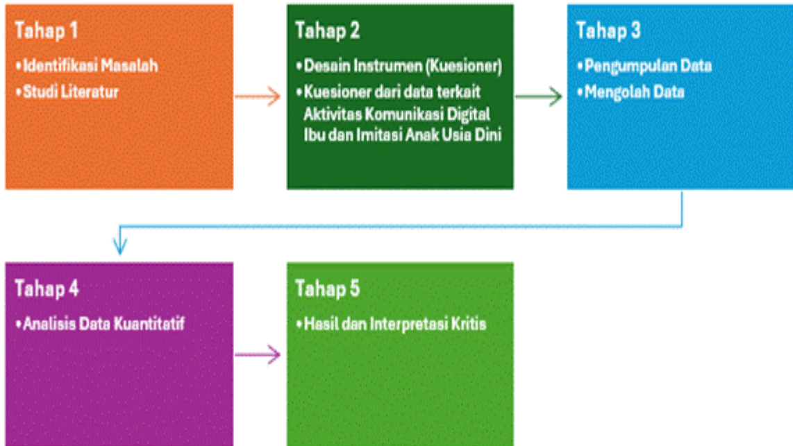
Gambar 2 Tahapan Penelitian

Secara keseluruhan, rangkaian metode survei kuantitatif ini dipilih untuk memberikan gambaran yang objektif dan terukur mengenai realitas komunikasi digital antara ibu dan anak di Kabupaten Bandung. Penggunaan kuesioner berbasis Teori SOR dan Teori Belajar Sosial ini diharapkan mampu menghasilkan data yang valid untuk memetakan sejauh mana aktivitas komunikasi digital memiliki dampak signifikan terhadap perilaku meniru anak pada fase perkembangan golden age. Seluruh proses penelitian dijalankan dengan menjunjung tinggi prinsip etika penelitian, menjamin anonimitas responden, serta memastikan transparansi pengolahan data sesuai dengan standar akademik. Hal ini dilakukan guna menghasilkan studi yang kritis dan mendalam mengenai implikasi kehadiran gadget/ponsel dalam pola asuh kontemporer.